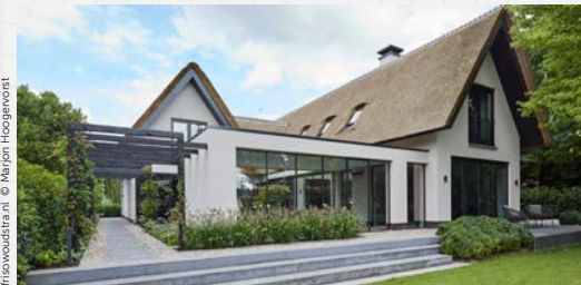
FRISO WOODSTRAAT © MARION HOOGEMOEST

Op het eerste gezicht lijken dit traditionele, stalen ramen, maar niets is minder waar. Het nieuwe Stratolo-raam van Profel is een hedendaagse variant van het authentieke stalen raam met een fijn profiel, maar dan van aluminium. De troeven: goede isolatiewaardes, duurzaam en een tikkeltje goedkoper dan stalen ramen. Verkrijgbaar in diverse kleuren. Prijs op aanvraag. profel.be