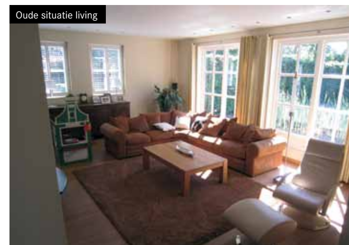
Oude situatie living