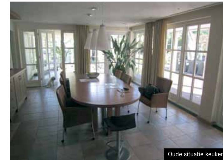
Oude situatie keuken

Waar voorheen de living bestond uit twee aparte gedeeltes, is er nu sprake van een fraai geheel. Er is een ruime zithoek gecreëerd waar het hele gezin kan relaxen op de loungebank en kan genieten van de